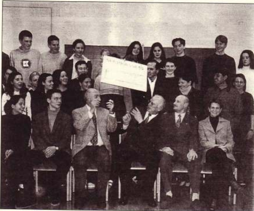
Schrecksekunde für Koits: Huch der Scheck ist weg!